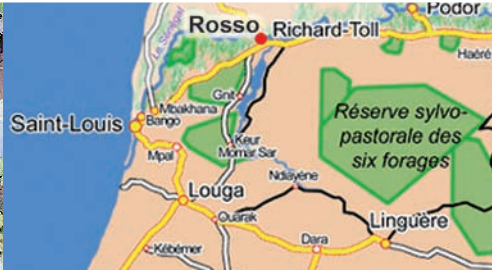
La ville de Rosso dans la région du fleuve Sénégal